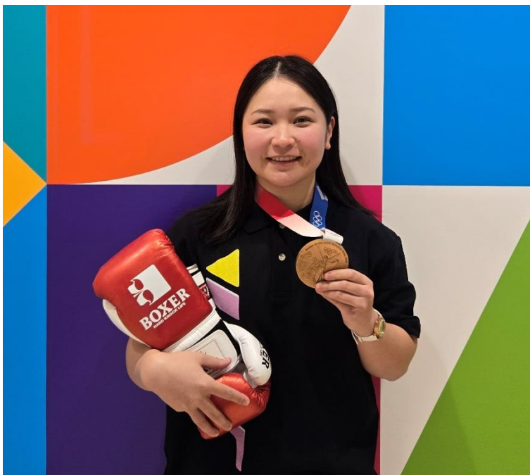
並木 月海選手 ボクシング 東京オリンピック 女子フライ級 銅メダル

このたび、2021年東京オリンピックのボクシング女子フライ級で銅メダルを獲得した並木月海（なみきつきみ）選手（個人アスリート支援プログラム対象従業員）が新規支援対象者としてアスリートアンバサダーに着任いたしました。当社グループが支援する個人アスリート支援プログラム対象者は総勢4名となりました。本年は東京2025デフリンピックが予定されており、デフサッカー日本代表候補の宮田選手の活躍が期待され、そのほか各選手の世界大会も予定されており、当社のスポーツアンバサダーとしての活躍が期待されます。