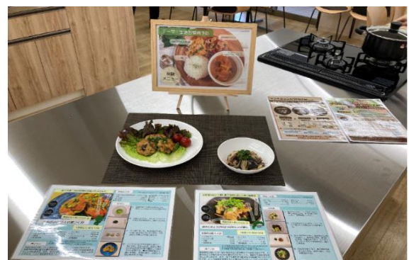
レシピのイメージ