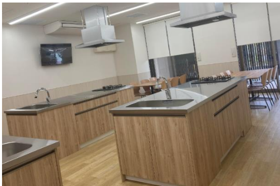
キッチンスタジオ内の設備

ココカラファイン薬局大阪はびきの中央店では、併設のキッチンスタジオにおいて料理教室を定期的で開催しており、おいしく手軽に健康について学べる場としてご好評いただいています。栄養ケアの地域拠点として機能を強化し、栄養と食を通じて地域の健康支援ができるよう、新たな実践的健康支援サービスの展開を進めてまいります。