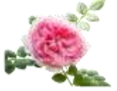
イゼヨイバラエキス ※16

肌荒れ予防・整肌効果の高い3種の植物エキス ※16-18 がうるおいを与え、くすみ ※19 、ごわつき、目立つ毛穴ヘアプローチ。明るい肌印象をキープします。