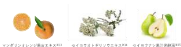
マンダリンオレンジ果皮エキス ※13