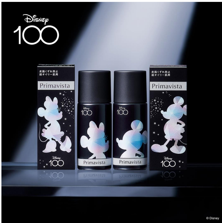
ディズニー100 限定テーマのミッキー、ミニーマウスデザイン