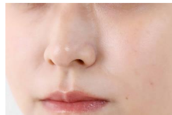
保湿後の肌の状態