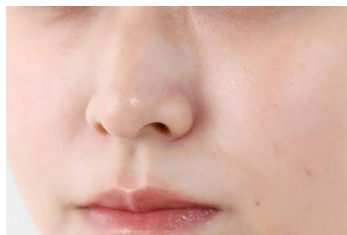
保湿前の肌の状態