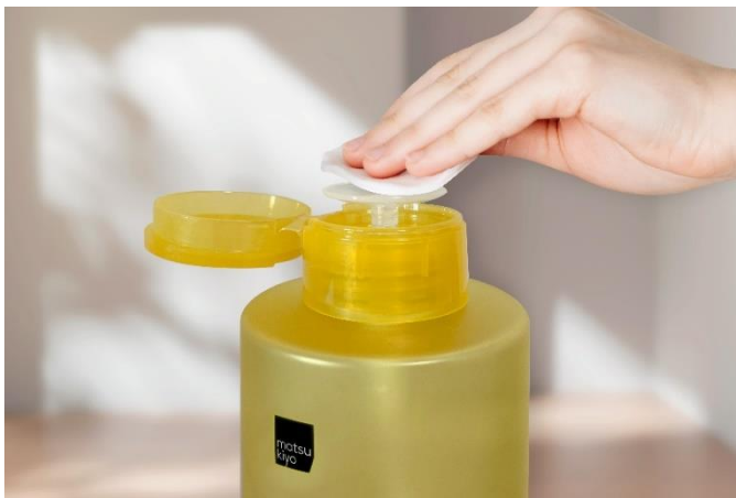
matsukiyo クレンジングウォーター コットンポンプボトル