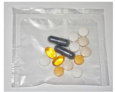
サプリメント 1包化

店舗に常駐する管理栄養士が、はじめにお客様の食生活と生活習慣を詳細にカウンセリング致します。そのカウンセリングデータを基に、不足しがちな栄養素を見出して、個々のお客様に最適なサプリメントを分包して提供するオーダーメイドサービスです。