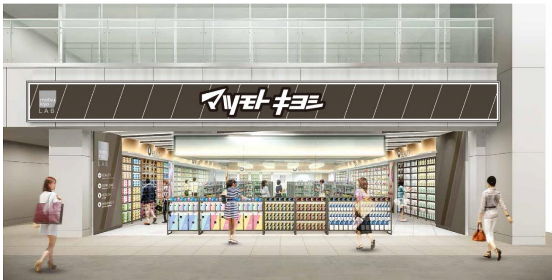
リニューアル後の新松戸駅前店の外観(完成予想図)