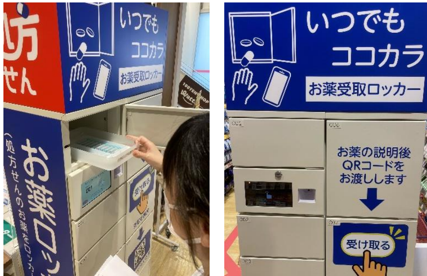
中目黒店に設置したお薬受取ロッカー

https://corp.cocokarafine.co.jp/news/pdf/20210413_PR01.pdf