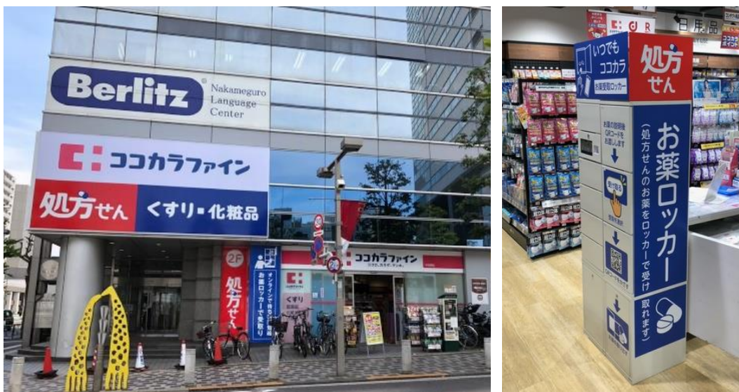
ココカラファイン薬局中目黒店とお薬受取ロッカー

ココカラファインは、オンライン服薬指導への対応環境整備やお薬手帳アプリの導入による待ち時間短縮など、患者様のニーズに合わせた取り組みを積極的に推進しています。今後も、患者様や地域の人々が安心して医療を受けることができる体制づくりに積極的に取り組んでまいります。