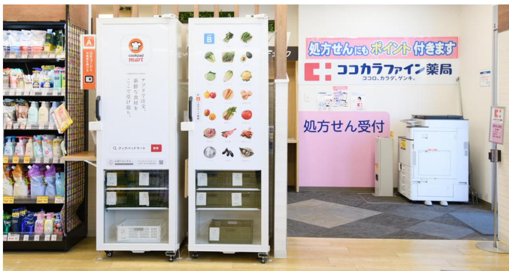
生鮮宅配ボックス「マートステーション」

この度は利用者の好評に応え、東京都・神奈川県 の 50 店舗に設置を拡大いたします。今後は設置店舗や連携販売の拡大、店舗内でのクックパッドマート商品の設置販売の検討も含め、生鮮食品販売の連携を強化し、両社の強みを活かして事業展開を進めてまいります。